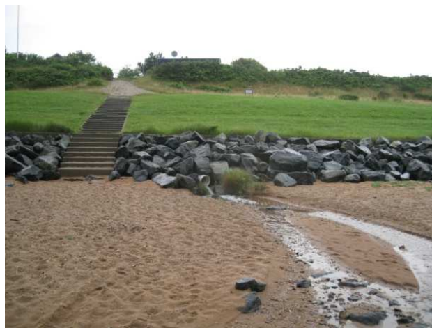
Nordlige og sydlige udløb i regnvejr. Badning frarådes i udløbet.

Esbjerg Kommune opfordrer til at strandens gæster bader indenfor den definerede afgrænsning af stranden, hvor kommunen rutinemæssigt kontrollerer badevandskvaliteten i badevandssæsonen (1. juni – 1. september). Der er dog ingen fysisk afgrænsning til Sjelborg Strand mod nord og Strandpromenaden mod syd. Der henvises til badevandsprofilerne for disse. Badende ved stranden bør altid være opmærksom på, at pludselige forureninger af badevandet kan opstå i forbindelse med f.eks. uheld fra lystbåde, gylletanke og kloakledninger. Hvis Esbjerg Kommune modtager oplysninger om forurening, der kan påvirke badevandet eller skade de badendes sundhed, vil kommunen varsle om dette på skiltet ved badebroen og på kommunens hjemmeside: Badevand hjemmeside .